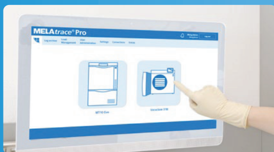
✓ Dokumentáció és jóváhagyás a MELAtrace-el