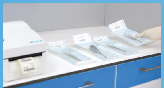
✓ Jelölés a MELAprint 80-al